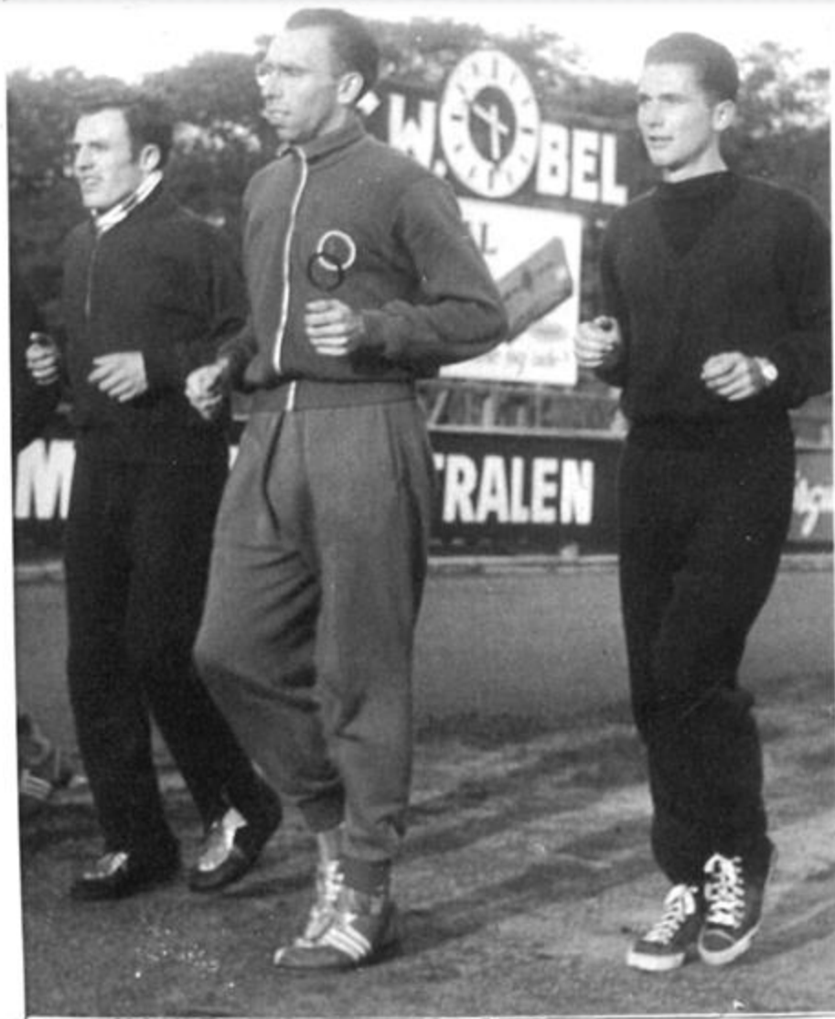
Meeting international d'Aalborg (Dnk) le 31 août 1957.